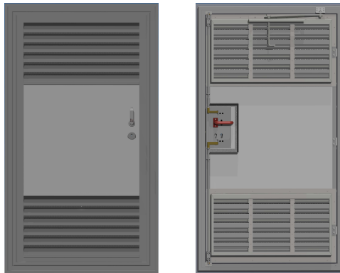
Abbildung 1- Aluminiumtür Typ TAM3 RC2: links Außenansicht; rechts Innenansicht

einbruchhemmend RC2 nach DIN EN 1627:2011